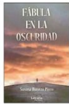
FÁBULA EN LA OSCURIDAD Susana Burotto, Editorial Letrame, 2023, 188 pp., $17.500

Los signos que marcan este libro son la delicadeza y la sutileza, dos valores que escasean en la narrativa actual, la cual suele optar por un realismo en que la crudeza y la obscenidad se hacen meramente sinónimas de la verdad.