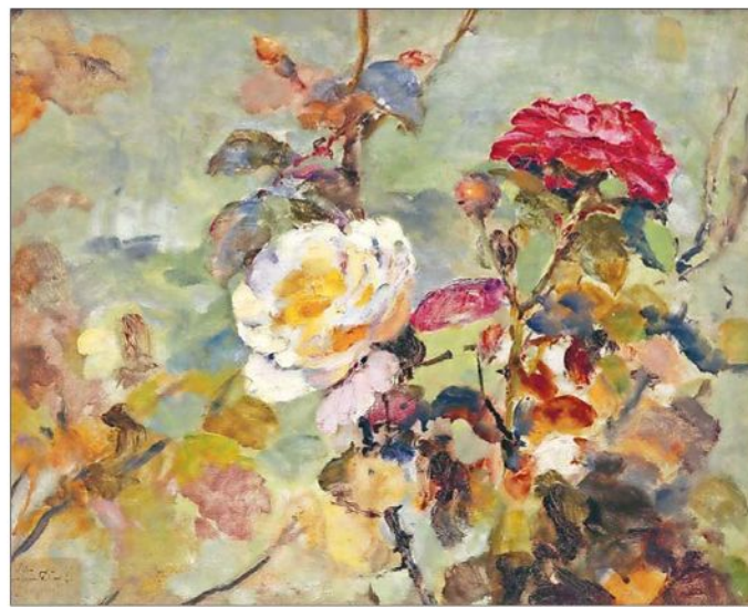
Las flores y rosas constituyen uno de sus géneros más celebrados.

Y Sánchez adelanta: "Para futuras muestras los coleccionistas están considerando seriamente entregar en comodato sus colecciones confiando en que vamos a cuidar y preservar esas obras. Hay una gran confianza en la universidad. Además, nosotros incorporamos a los donantes o comodantes en el trabajo que hace-