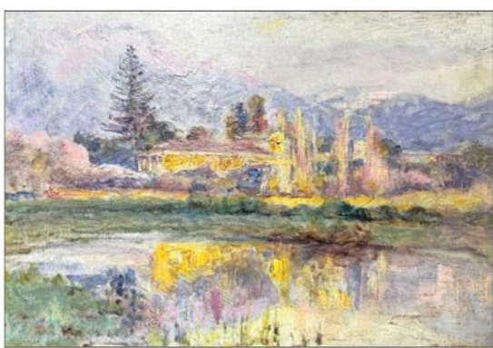
"Santa Rita". El campo era de la familia García Huidobro, la del poeta Vicente y su gran amigo escultor, Domingo.