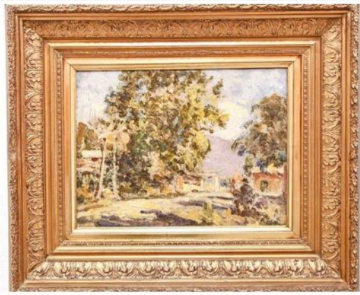
"Pintando al aire libre", Juan Francisco González, 1910. Un autorretrato notable que dialoga con una escultura.