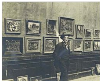
El artista en pleno montaje de una exposición, en Santiago, en 1916.

que ya hemos visto en otros ámbitos culturales y de arte. Hemos estado en contacto con familias y coleccionistas que tienen mucha pintura chilena para invitarlos a exhibir. Y también invitarlos a que donen algunas obras a la universidad. Hay una enorme confianza en nosotros, la estamos viendo hoy para esta primera exposición. Hay numerosos coleccionistas que se han comprometido a donar una, dos o más obras".