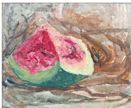
"Sandía", la última obra que pintó.

alejó al público. Nosotros queremos llegar a una audiencia amplia".