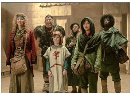
"Time Bandits" es un remake de un clásico británico.

abismo entre los que tienen y los que no se hace más y más grande. Es algo que hemos visto en los últimos años, en particular con el covid", explicó.