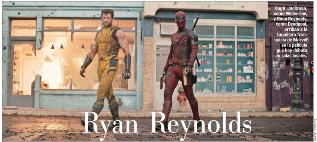
Hugh Jackman, como Wolverine, y Ryan Reynolds, como Deadpool, arriban a la taquilla franquicia de Marvel en la película que hoy debuta en salas locales.