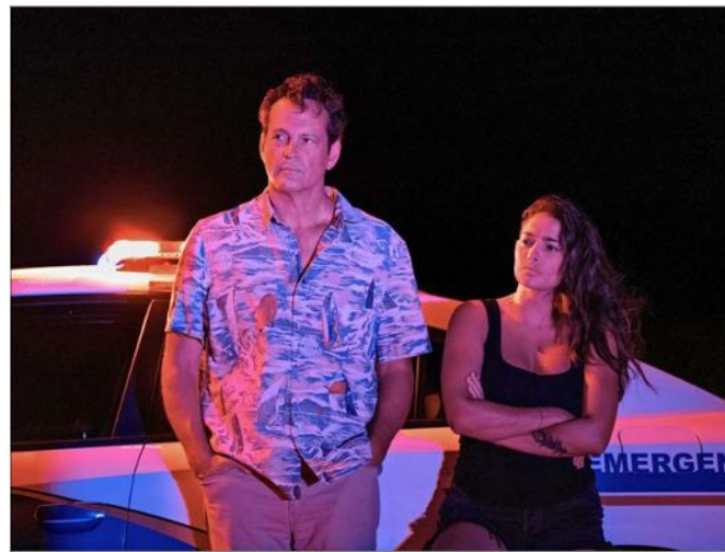
Vince Vaughn y Natalie Martinez son los protagonistas de "Bad Monkey".