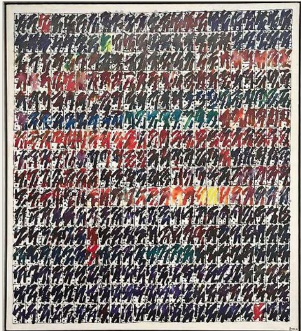
Abstracción, 1990. Integra una notable serie de gran formato que se expone en el MAC. Sobresale el ritmo que asocia a la música. Stravinsky es su preferido.