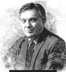
La columna de Alejandro Vigo

En la filosofía social y política, y también en el debate político contingente, la cuestión relativa a las relaciones entre el mérito y la fortuna ha dado lugar a acaloradas controversias entre posiciones (más o menos) libertarias, defensoras de la llamada "moral del mérito", y posiciones (más o menos) igualitaristas, que enfatizan la necesidad de mitigar y hasta eliminar las "inequidades de la fortuna", por vía de intervención estatal. Tratándose de un asunto cuyas raíces se hunden hasta las entrañas de la conditio humana , no puede sorprender que, por momentos, la discusión adquiera un carácter casi metafísico y parezca, así, interminable. Además, toda ella suele estar lastrada por presuposiciones no examinadas, que, a veces, son compartidas por las partes en pugna. Por caso, se suele dar por sentado que, a la hora de discutir los problemas concernientes al