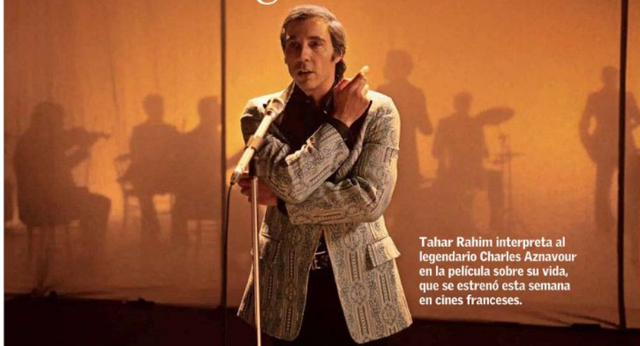
Tahar Rahim interpreta al legendario Charles Aznavour en la película sobre su vida, que se estrenó esta semana en cines franceses.