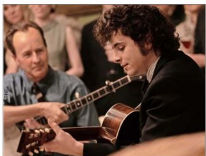
Timothée Chalamet y Edward Norton (al fondo) en una escena de “Un completo desconocido”.

varon a la participación de Dylan en el festival de música folk de Newport en 1965. Era su tercera vez en ese evento, pero la primera que subió al escenario con una guitarra eléctrica, momento que creó un antes y un después en la historia de ese género musical. Edward Norton,