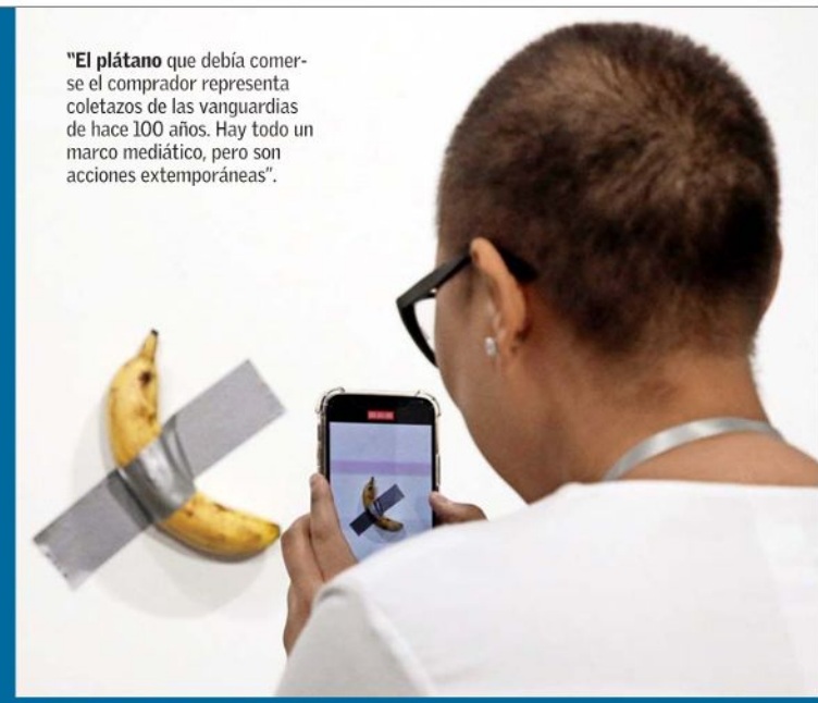
“El plátano que debía comerse el comprador representa coletazos de las vanguardias de hace 100 años. Hay todo un marco mediático, pero son acciones extemporáneas”.

“El mundo está sentado en un polvorín y el arte es el reservorio: involucra al ser humano en su totalidad”.